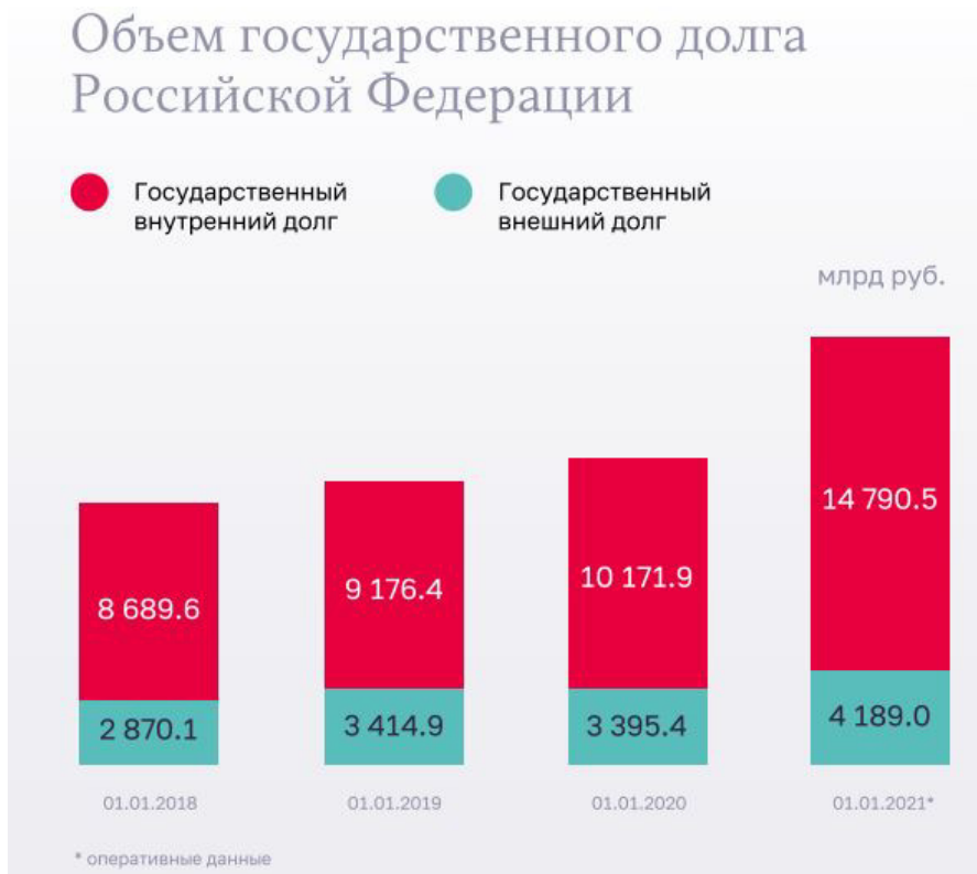
Рис. 2. Объем государственного долга Российской Федерации [3].

2. Государственные гарантии Российской Федерации